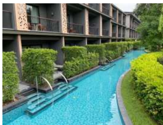
ภาพที่ 1.2-2 – สภาพโครงการปัจจุบัน